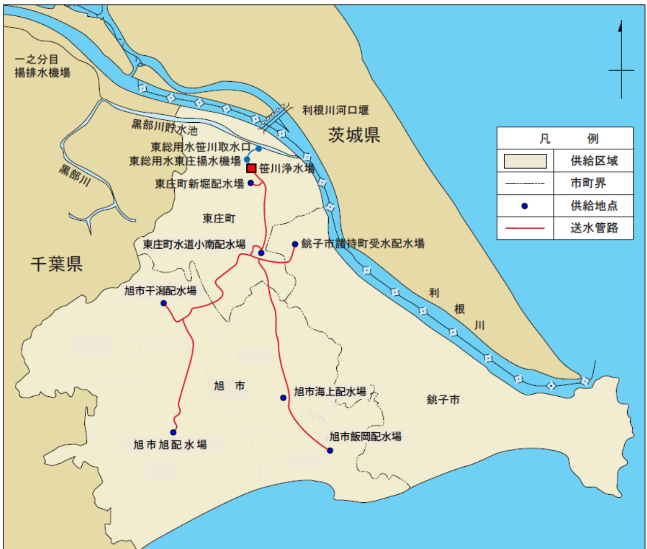
図－2 構成団体への水道用水受け渡し地点