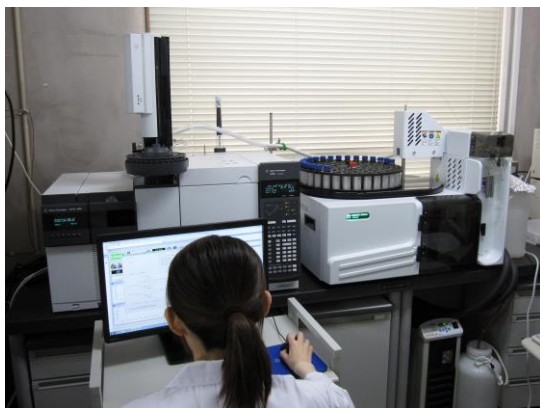
ページ・トラップーガスクロマトグラフィー質量分析装置 （臭気物質検査）