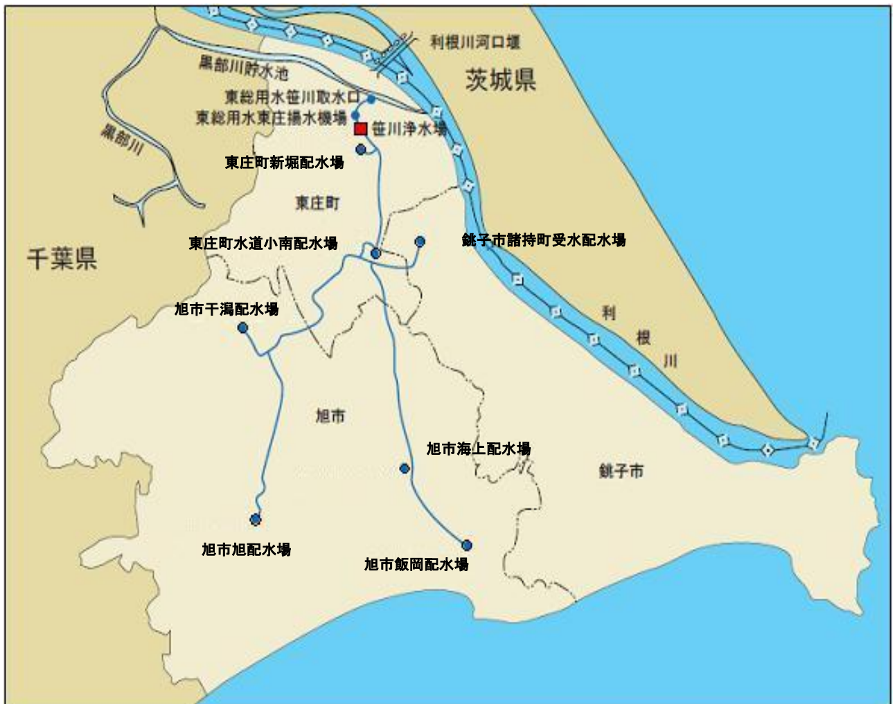
図－２ 構成団体への水道用水受け渡し地点