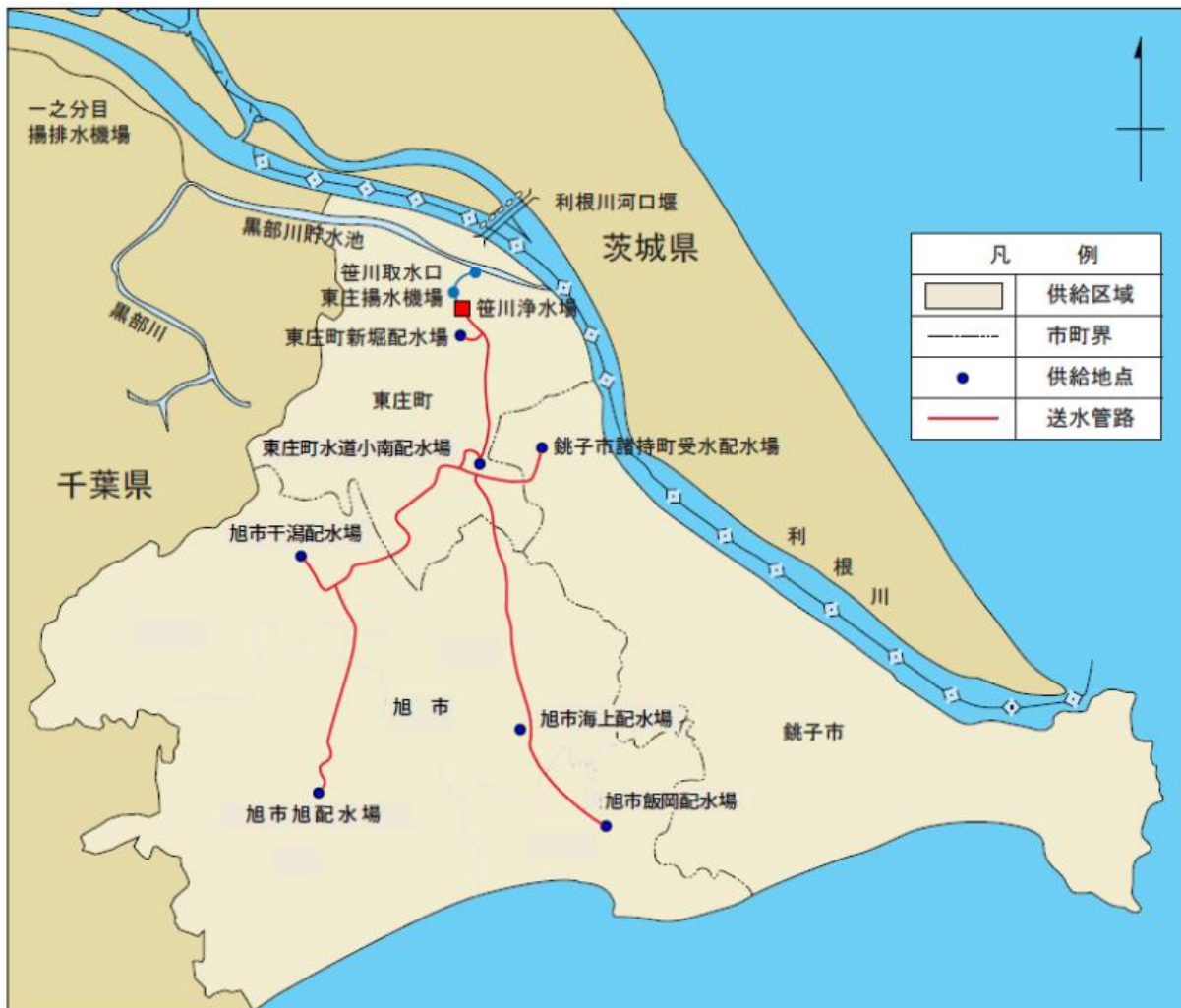
図-2 構成団体への水道用水受け渡し地点